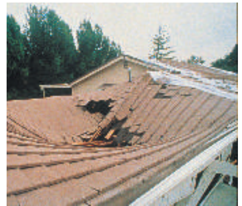
Țiglele din beton, prin alunecare, provoacă prăbușirea structurii de rezistență