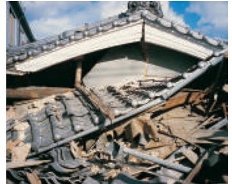
Acoperișurile tradiționale din țiglă ceramică sunt foarte grele, în caz de cutremur, afectând integritatea structurii de rezistență

În zona afectată, majoritatea acoperișurilor erau din țigle de beton sau ceramică și erau impropriu fixate, permițând acestor materiale să cedeze. Greutatea acestor materiale, montajul și structura inadecvată de susținere au fost factori determinanți pentru realizarea pagubelor sau chiar prăbușirea acoperișurilor.